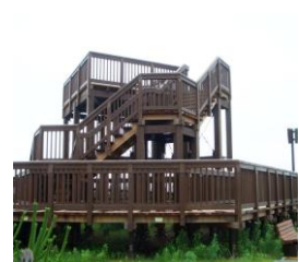
国営公園木部保護