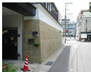
寺院砂岩壁面カビ防止