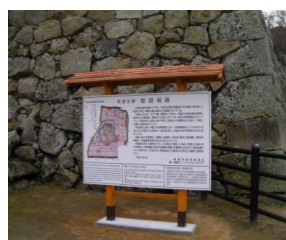
国宝姫路城案内板木部